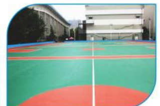
室外篮球场维修后照片