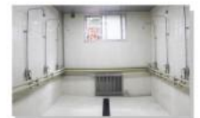
学生男女浴室维修后照片