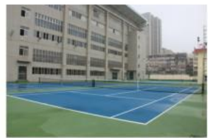
第二网球场维修后照片