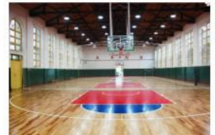
旧篮球馆维修后照片