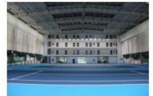
旧网球馆附房维修后照片