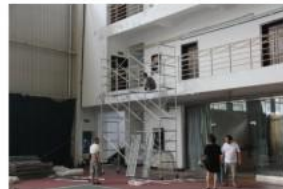
旧网球馆附房维修前照片