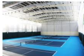
旧网球馆维修后照片