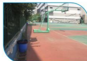
室外篮球场维修前照片