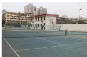
第二网球场维修前照片